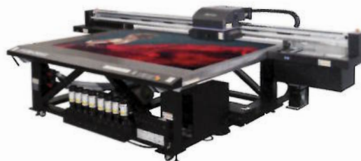
Der JFX200-2513 EX feierte auf der Fespa in München Premiere. Er druckt auf bis zu 2.500 mal 1.300 Millimeter große Substrate.

Mimaki hat ihn erstmals auf der Fespa 2019 in München gezeigt: den JFX200-2513 EX, einen neuen großformatigen UV-Flachbettdrucker. Er ist mit einem neuen Druckmodus sowie einem zusätzlichen Druckkopf ausgestattet. Laut dem Hardwarehersteller druckt er im Vergleich zu seinen JFX-Vorgängern im neuen Entwurfsmodus in vier Farben plus Weiß um bis zu 280 und in allen anderen Druck-