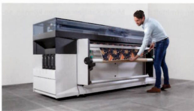
Der neue 64-Zoll-Rolle-zu-Rolle-Drucker Océ Colorado 1650 von Canon

Canon stellt den Océ Colorado 1650 vor, einen 64-Zoll-Rolle-zu-Rolle-Drucker. Er basiert auf dem 1640er-Modell und druckt mit flexiblen Canon UV-Gel-Tinten. Letztere erlauben zudem das Falten und Biegen von Druckmedien, ohne dass eine Gefahr von Rissen bestünde. Neu sei außerdem Océ Flxfinish, eine neue Technik der LED-UV-Härtung, gibt das Unternehmen an. Sie ermögliche es, durch den Wechsel zwischen Matt- und Hochglanzmodus verschiedene Effekte zu erzielen – ohne vorher Tinte oder Druckmedium wechseln zu müssen. Zudem druckt der Océ Colorado 1650 auf eine Vielzahl verschiedener Medien,